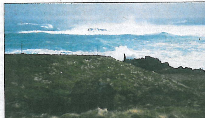
Sjøsprøyt: De gamle kvernhusa i Kråkenes har opplevd storm og sjøsprøyt før.