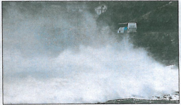
Trafikk: Bølgene slo over rutebussen på vei til Oppedal i Vågsøy, enda den var 20 meter inne på land. Det var stor trafikk til Oppedal og Kannesteinen for å se på uværet.