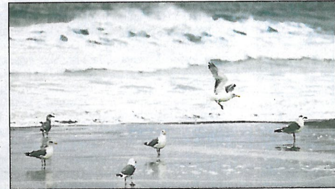
På stranda: Måsane på Refviksanden tok stormen med ro.