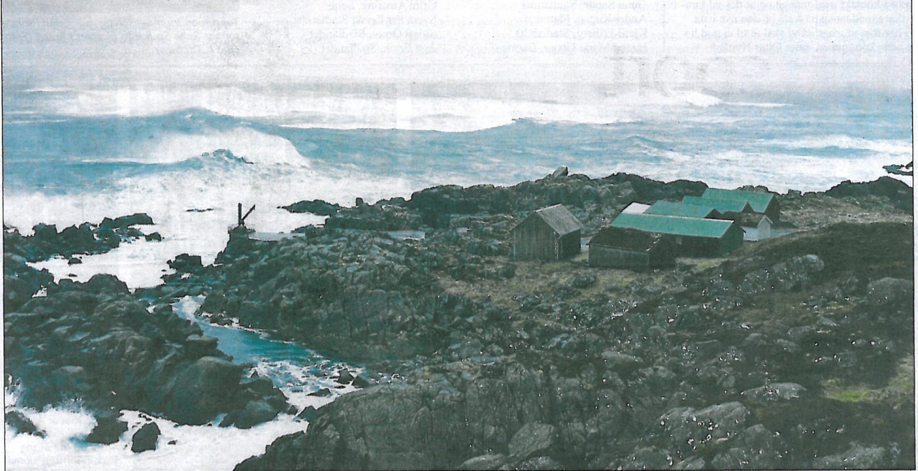
Ruskevær: Fredag var det ikke vanskelig å forstå hvorfor naustene til folk i Kråkenes ligger godt tilbaketrasket fra sjøen.

Stormen som raste på kysten fredag fikk mange til å ta turen til værharde steder som Kråkenes og Stadlandet for å oppleve naturkrefte. To av dem vi traff kom heilt fra Bergen.